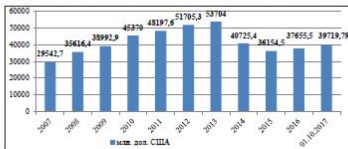
Рис. 1. Обсяги прямих іноземних інвестицій (за 2014-2017 рр. без урахування тимчасово окупованої території Автономної Республіки Крим і м. Севастополь, а також без частини зони проведення антитерористичної операції)

Капітальні вкладення визначають розвиток матеріально-